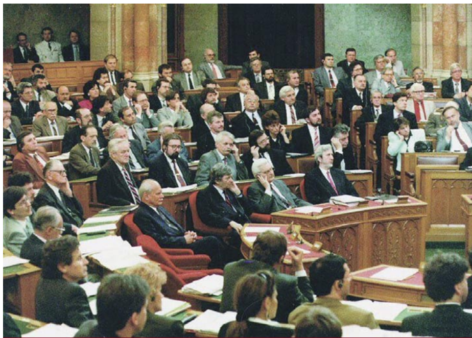
AZ ÚJ PARLAMENT ALAKULÓ ÜLÉSE. A TERV SIKERÜLT, TÓKÉS ERŐK MEGDÖNTÖTTÉK A SZOCIALIZMUST

Az Országgyűlés 1989. október 17–20-i ülésén elfogadta „Az Alkotmány módosításáról” szóló 1989.