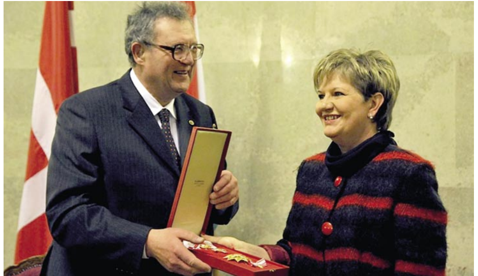
SZILI KATALIN MAGYARORSZÁGÉRT DOLGOZIK. ÁTVESZI A MÁLTAI LOVAGREND KITÜNTETÉSÉT

Ezzel a mondattal indokolják – esetünkben Mécs Imre egykori SZDSZ-es, most éppen MSZP-s képviselő –, hogy miért kell távozásuk után is akár hosszú évekig fizetnünk a „közjogi méltóságokat”. Ezért jár 2013 novemberéig neki a sofőr és az autó és 2011 júliusig a kétfős titkárság. Mindez természetesen járt – esetében négy évig, hiszen állami kocsit annyi időre kapnak még, amennyi ideig posztjukon voltak – Orbán Viktornak is. A volt miniszterelnök így állami pénzen szervezhette a Fideszt. Mint ahogy állítólag az MSZP megújításán is adóforintokért fog küzdeni Szili Katalin is. A leköszönt házelnök szeptember elsején még felvette 4,5 millió forintot végkielégítését, majd limuzinjába ült, amely 2017-ig oda szállítja, ahova akarja. Természetesen a parlamenti képviselők is, amennyiben nem választják újra őket, azaz megbuknak, kapnak hat hónapnyi bánatpénzt.